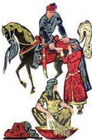
2-rasm (Kuntugmish-“Muhabbat motivi”)aks etgan rasm

Ushbu maqolada taklif etilayotgan kompleks mahsulot besh integratsiyalashgan blokdan iborat.