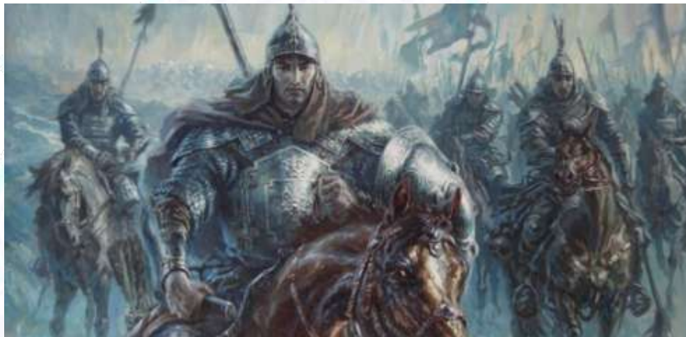
1-rasm (Alpomish dostonidan-“Jang sahnasi”) 1

performative turizm uchun mustahkam kontent bazasini yaratdi. “Kuntug’mish” dostonidagi muhabbat motivi, to’y marosimlari, milliy kiyim va zargarlik elementlari esa romantik-etnografik va sahnalshtirilgan turizm formatiga mos keladi. Ushbu ikki syujet yo’nalishining sintezi mahsulotni tematik diversifikatsiya qilish mkonini beradi: qahramonlik-sarguzasht( adventure heritage) va romantik-marosim (ceremonial heritage) segmentlari parallel rivojlantiriladi, bu esa maqsadli auditoryani kengaytiradi.