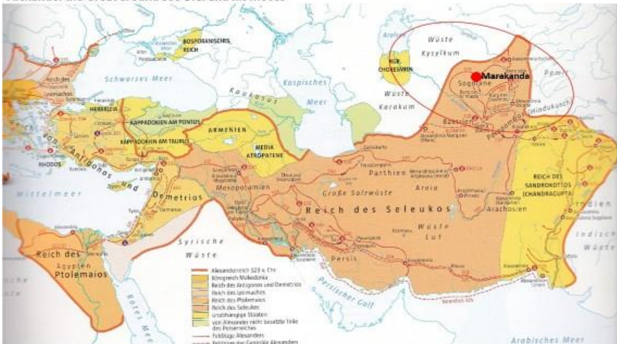
Alexander the Great around 300 B.C. and his moves