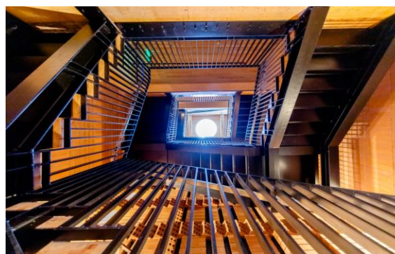
4-rasm. T3 Airport Terminal (AQSH shaharda)

Bu esa jamoat makonlarining ijtimoiy va funktsional ahamiyatini yanada oshiradi.