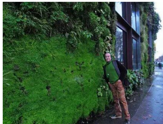
1-rasm. Quai Branly Museum (Parij). Patrick Blanc (Fransiya) — vertikal bog'lar asoschisi

2. Tabiiy yorug'lik - inson organizmining biologik ritmlariga ijobiy ta'sir ko'rsatadi. Katta oyna ochiqliklari, atriumlar va shisha tomlar orqali tabiiy yorug'likdan samarali foydalanish: