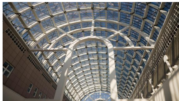
2-rasm. Gardens by the Bay (AQSH davkati Xyuston shahri)

3. Suv elementlari - jamoat makonlarida estetik va psixologik ahamiyatga ega. Fontanlar, sun'iy havzalar va suv devorlari: