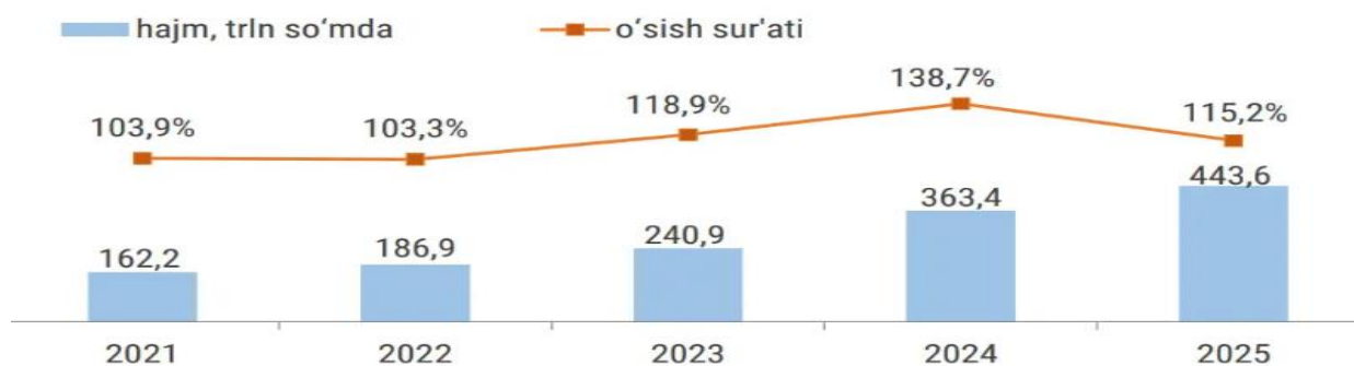
1-rasm. Asosiy kapitalga investitsiyalar dinamikasi.

To‘qqiz oy yakunlariga ko‘ra, 443,6 trln so‘m — o‘tgan yilga nisbatan 15,2% ko‘p mablag‘ sarflandi. Birinchi to‘qqiz oylik ma‘lumotlar shuni ko‘rsatadiki, mo‘tadil budjet siyosati fonida hozirgi tendensiya barqaror ko‘rinadi.