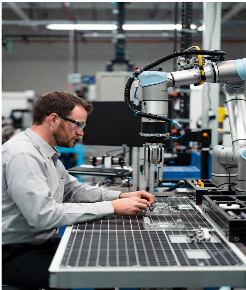
Rasm 3: Inson-robot hamkorlikdagi ergonomik ish o‘rni.