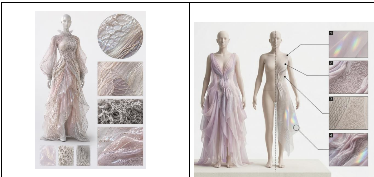
Рис. 2. Научная визуализация романтического образа с использованием инновационных текстильных технологий, многослойных полупрозрачных материалов, 3D-вязаных рельефных структур, лазерной гравировки и интегрированных металлизированных нитей.

качественно новые возможности для формирования авторских фактур, специально проектируемых под художественный замысел [6]. Применение смешанных волокон, многослойных структур, вплавленных металлических нитей, термообработки и лазерной гравировки позволяет формировать сложные рельефы, переменную плотность и светоотражающие эффекты, недостижимые традиционными методами ткачества рисунок 2.