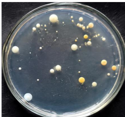
2-rasm. Oligonitrof mikroorganizmlarning laboratoriyada olingan taxlil natijalari

Oligonitrof mikroorganizmlarning 7 \times 10^1 KOE/g miqdorida uchrashi tuproqning organik moddalar bilan kam ta'minlanganligini tasdiqlaydi. Ushbu mikroorganizmlar oziq moddalar tanqis bo'lgan muhitlarga moslashgan bo'lib, ekologik stress sharoitida ham hayot faoliyatini saqlab qolish xususiyatiga ega. Biroq ularning nisbatan past miqdorda bo'lishi ekstremal sho'rlanish va quruqlik omillari ta'sirida mikrobiologik hamjamiyatning umumiy rivojlanishi cheklanganligini anglatadi.