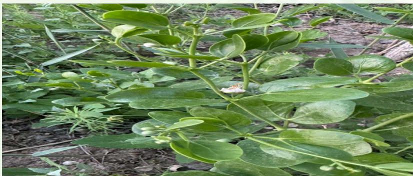
2-rasm: Tuyatovon o'simligining dala sharoitida yetishtirilishi

Tuyatovon - Zygophyllum fabago o'simligini dala sharoitida madaniy yetishtirishning fenologik spektri;