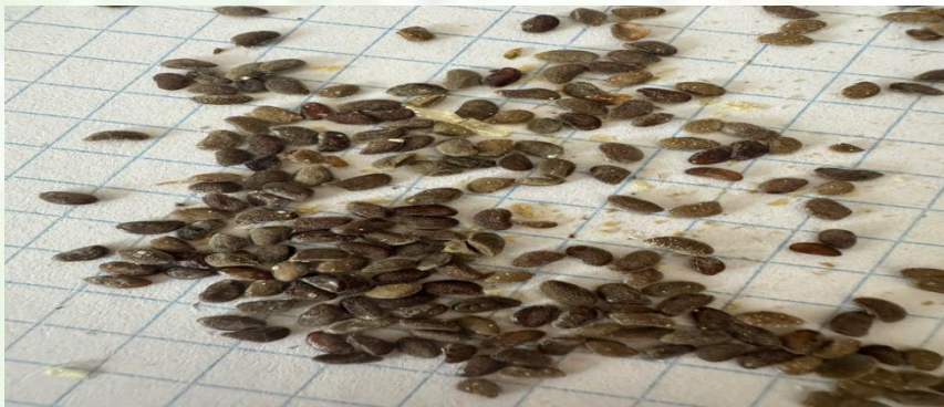
1-rasm: Tuyatovon o'simligining ajratilgan urug'lari

Organik o'g'itlar (kompost yoki gumus) tuproqni boyitishda samarali bo'ladi. Bir necha mikroelementlar va fosfor, kaliy, azot kabi mineral o'g'itlar o'simliklarning o'sishi uchun foydali bo'lishi mumkin. [3].