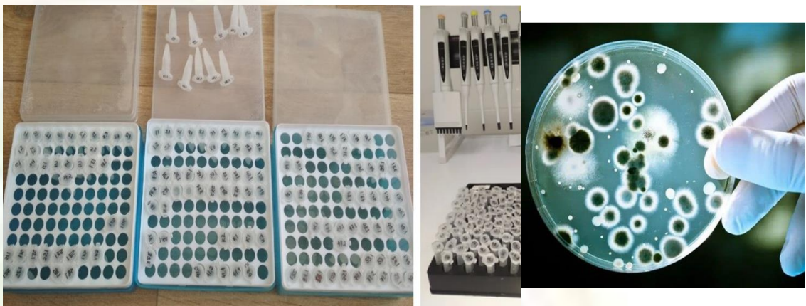
3-расм. Пробиркага йиғилган оғиз суюқлиги

Иммуноглобулинларни аниқлаш учун оч қоринга ёки овқатдан кейин камида бир соат ўтиб, аралаш стимулланмаган сўлак олинди [6]. Сўлак эрталаб соат 9.00 дан 11.00 гача — максимал секретсия даврида тўпланди. Шундан сўнг бемор кейинги 3-5 дақиқа давомида куруқ пробиркага 2 мл атрофида оғиз суюқлиги йиғди (3-расм).