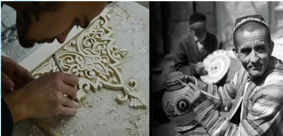
Рисунок 3. Резьба по ганчу.

В резьбе по ганчу (Самарканд, Варахша) и дереву (в Сурхандарьинской области) в узор вплетаются тематические мотивы, а плоские рельефные орнаменты заменяются объемными фигурами (см. рис. 3).