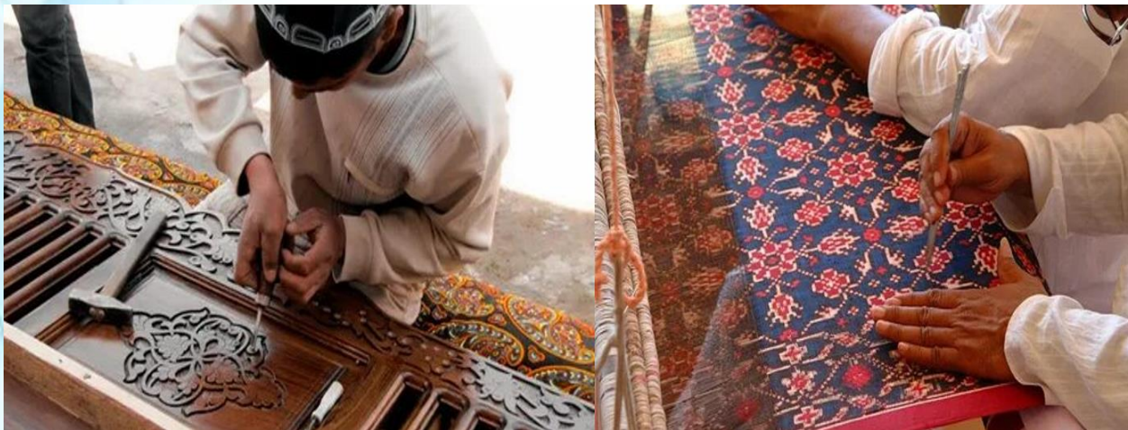
Рисунок 4. Декоративные произведения в различных областях прикладного искусства.

сосудах, их росписи и глазуровки. Первоначально сосуды изготавливались с простым зелёным декором, покрытым матовой глазурью, или с глазурью в виде пятен 2-3 разных цветов, но в X и XI веках на белый или кирпично-красный фон сосуда цветным ангобом наносился чёткий узор, который затем покрывался прозрачной свинцовой глазурью. Керамика этого периода (особенно афрасиабские сосуды) характеризуется гармоничным развитием декора и художественной формы, чёткой разработкой чёткого цветового декора и локальностью изображений (куфические надписи, изображения ветвей, тюльпанов, гранатов, виноградных листьев). Сосуды более позднего периода декорируются стилизованными растительными узорами, надписями и отдельными фигурками животных: широко выпускаются зелёные, ярко-синие глазурованные сосуды, неполивные изображения, узорчатая керамика (см.: рис. 4).