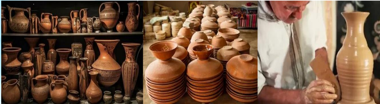
Рисунок 2. Керамика в прикладном искусстве.

сосудах и статуэтках, датируемых IV–II вв. до н. э. Декоративно-прикладное искусство раннего средневековья (V–VIII вв.) развивалось в связи с культурой государств Согд, Тохаристан, Хорезм и Фергана (см.: рис. 2).