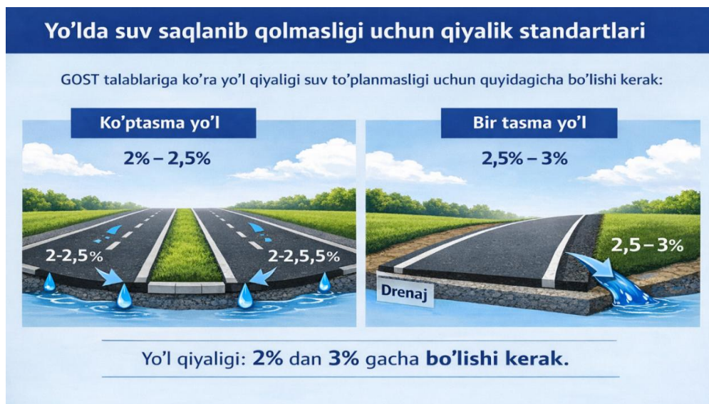
3-rasm. Yo'llarni namlikdan saqlash maqsadida ikkita qatnov qismili va bitta qatnov qismilik yo'llarda qiyalik darajasi.

Ko'tarilish joylarini saqlash juda muhim. Ko'tarilish kuz va qishda yo'l qatlamida namlik to'planishi va bahorda notekis erishi natijasida yuzaga keladi. Ko'tarilish, ayniqsa, qishki harorat noldan yuqori va past orasida o'zgarib turadigan hududlarda drenaji yomon bo'lgan joylarda yaqqol ko'rinadi. Yo'l qoplamasi ostida namlik to'planishi, shuningdek, suvning yoriqlar va boshqa nuqsonlar orqali o'tishiga olib kelishi mumkin bo'lgan noto'g'ri parvarish natijasida ham yuzaga kelishi mumkin. Ushbu xavfni oldini olish maqsadida namlikni belgilangan tatibda yo'lning qiyaligi natijasida drenajlarga chiqishini ta'minlash kerak 4.1.2-rasm.