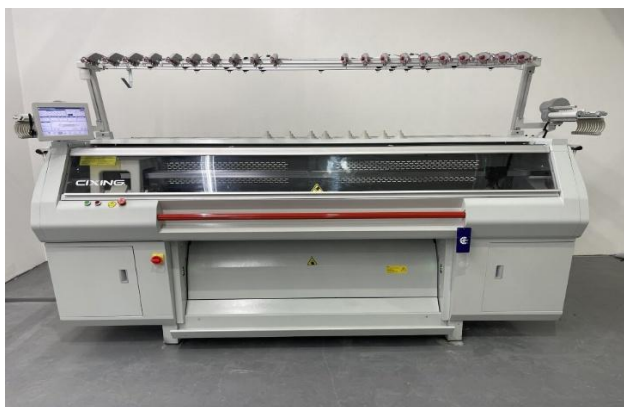
Рисунок 1. Плосковязальная двухфунтурная машина SIXING HP

Плосковязальная машина SIXING HP представляет собой современную компьютеризированную систему, предназначенную для производства широкого ассортимента трикотажных изделий. На рисунке 1 представлен внешний вид исследуемой машины.