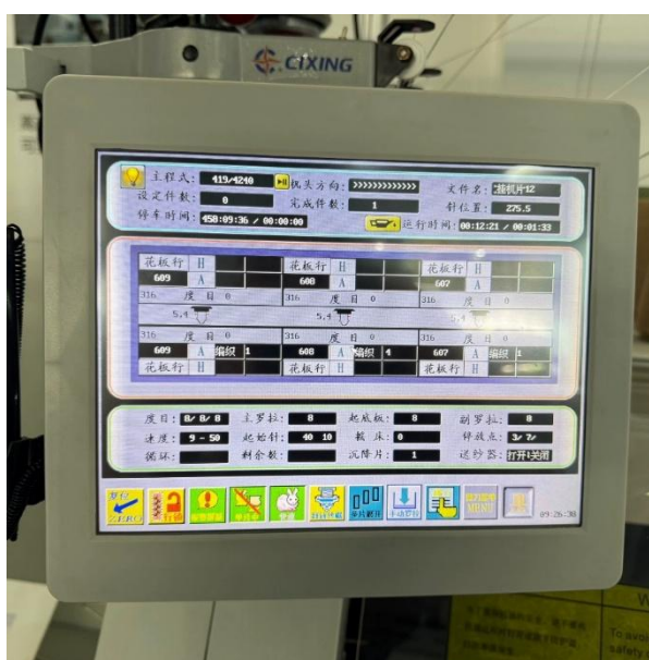
Рисунок 2. Автоматизированная система управления машины SIXING HP

Автоматизированная система управления машины SIXING HP представляет собой интеграцию механических, электронных и программных компонентов. Внешний вид системы управления представлена на рисунке 2.