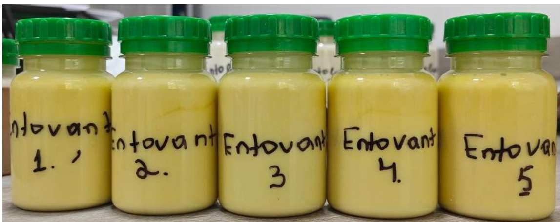
Рисунок 2. Новые композиции препарата “Entovant 15%”.

К началу испытаний агротехнические мероприятия были проведены вовремя. Испытания препарата проводились на крупных полях, размер опытных площадей по каждому варианту составил 5,8 га. Препараты наносили на растения путем полного опыления. Расход рабочей жидкости составил 300 л/га.