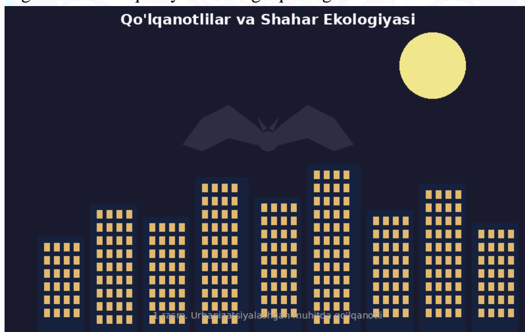
1-rasm. Urbanizatsiyalashgan muhitda qo'lqanotlilarning faolligi

Ushbu tadqiqot O'zbekiston shaharlarida, xususan Toshkent metropolisida qo'lqanotlilar turlarini aniqlash, ularning yashash joylarini xaritalash va hasharotlar nazoratidagi hissasini miqdoriy baholashga qaratilgan.