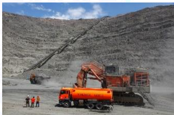
1-Rasm. NKMK (“Muruntov” koni)

Ishchilarga ta’sir etuvchi asosiy ekzogen va endogen omillarni quyidagi guruhlariga ajratish mumkin: