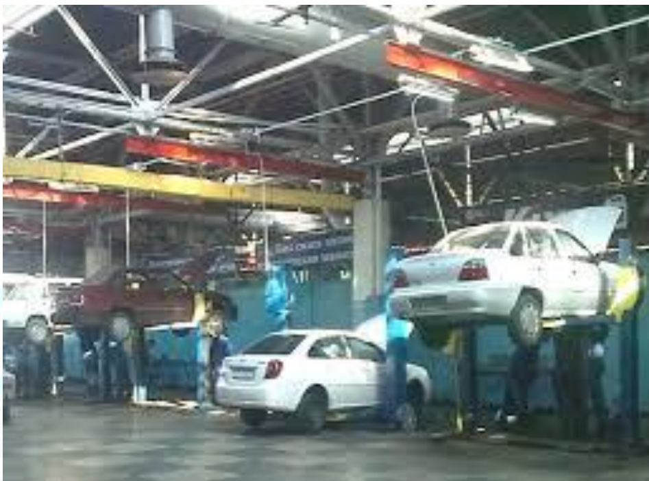
1-rasm. Avtomobillarga TXK

Transport vositalarining ekspluatatsiya ko‘rsatkichlari – ishonchlilik, chidamlilik, yonilg‘i tejamkorligi, ekologik xavfsizlik va texnik xizmat xarajatlari – transport tizimining umumiy samaradorligini belgilovchi asosiy omillar hisoblanadi. Ushbu ko‘rsatkichlarning yaxshilanishi esa to‘g‘ridan-to‘g‘ri TXK jarayonlarining to‘g‘ri tashkil etilganligi va zamonaviy yondashuvlar asosida takomillashtirilganligiga bog‘liq. Shu nuqtai nazardan qaraganda, TXK tizimini optimallashtirish nafaqat texnik, balki iqtisodiy va ekologik samaradorlikni ham oshirishga xizmat qiladi[3].