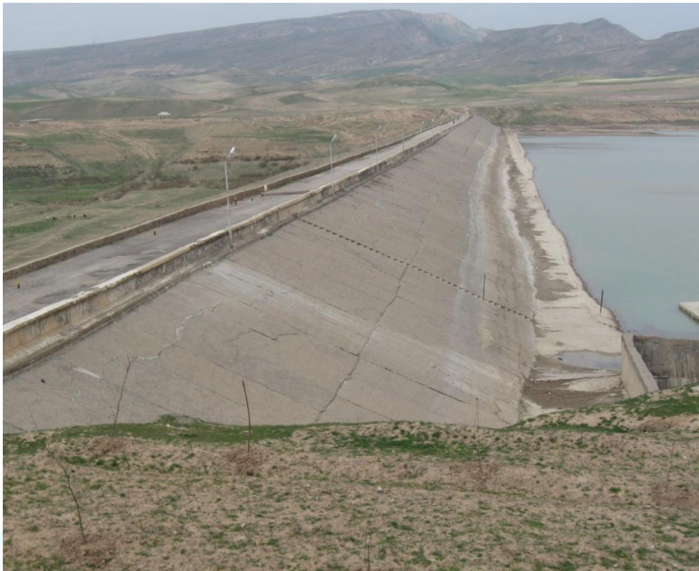
1-rasm. Dehqonobod suv omborining ko'rinishi

Tadqiqotimiz davomida ko'p yillik pezometr ma'lumotlari yuqori b'ef suv sathi NDS ga bo'lgan vaqtlardagi holatini monitoring qilish uchun har bir pezometrda o'lchov ishlari bajarilganligidan foydalanib, ushbu ma'lumotlarni tahlil qildik. Bunda PK 1+00 stvor tanlab olindi, bu stvorda 5 ta pezometr bo'lib har birining holati o'rganildi.