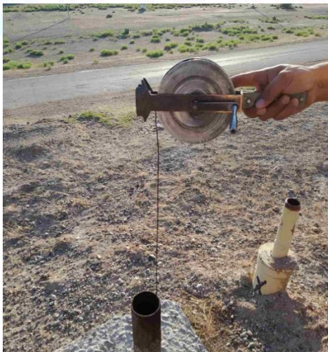
PK 1+00, 5 pezometr

Tadqiqotimiz davomida ko'p yillik pezometr ma'lumotlari yuqori b'ef suv sathi NDS ga bo'lgan vaqtlardagi holatini monitoring qilish uchun har bir pezometrda o'lchov ishlari bajarilganligidan foydalanib, ushbu ma'lumotlarni tahlil qildik. Bunda PK 1+00 stvor tanlab olindi, bu stvorda 5 ta pezometr bo'lib har birining holati o'rganildi.