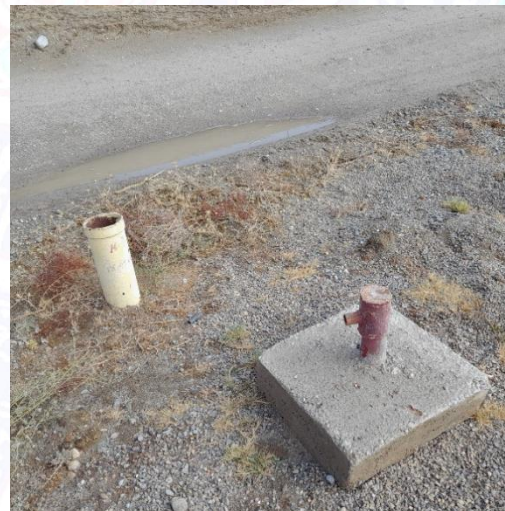
PK 1+00, 4 pezometr