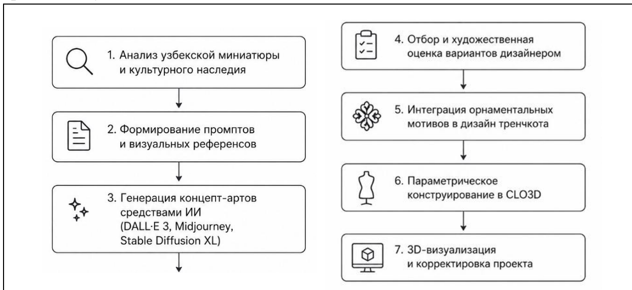
Рис. 2. Предлагаемая схема интеграции генеративного ИИ в процесс проектирования тренчкота с элементами узбекской миниатюры.

Кейс-стади. Для иллюстрации предложенной пятиэтапной схемы (рисунок 2) рассмотрим конкретный проектный кейс - разработку коллекции тренчкотов из органзы с миниатюрными орнаментальными узорами по мотивам живописи Камолиддина Бехзода (XV в.) и керамической фурнитурой ручной работы. Данный кейс представляет интерес как пример синтеза ретро-классики (конструкция тренча) и национального культурного кода в рамках глобального тренда на аутентичность и slow fashion.