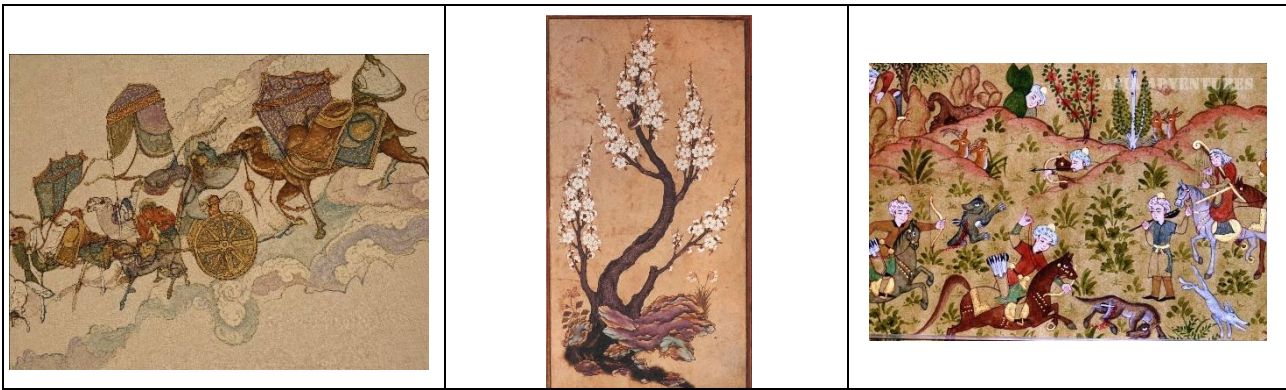
Рис 1. Образцы узбекской миниатюры XV–XVII вв., использованные в качестве визуального источника вдохновения для генерации орнаментально-композиционных решений дизайна тренчкота.

Кейс-стади. Для иллюстрации предложенной пятиэтапной схемы (рисунок 2) рассмотрим конкретный проектный кейс - разработку коллекции тренчкотов из органзы с миниатюрными орнаментальными узорами по мотивам живописи Камолиддина Бехзода (XV в.) и керамической фурнитурой ручной работы. Данный кейс представляет интерес как пример синтеза ретро-классики (конструкция тренча) и национального культурного кода в рамках глобального тренда на аутентичность и slow fashion.