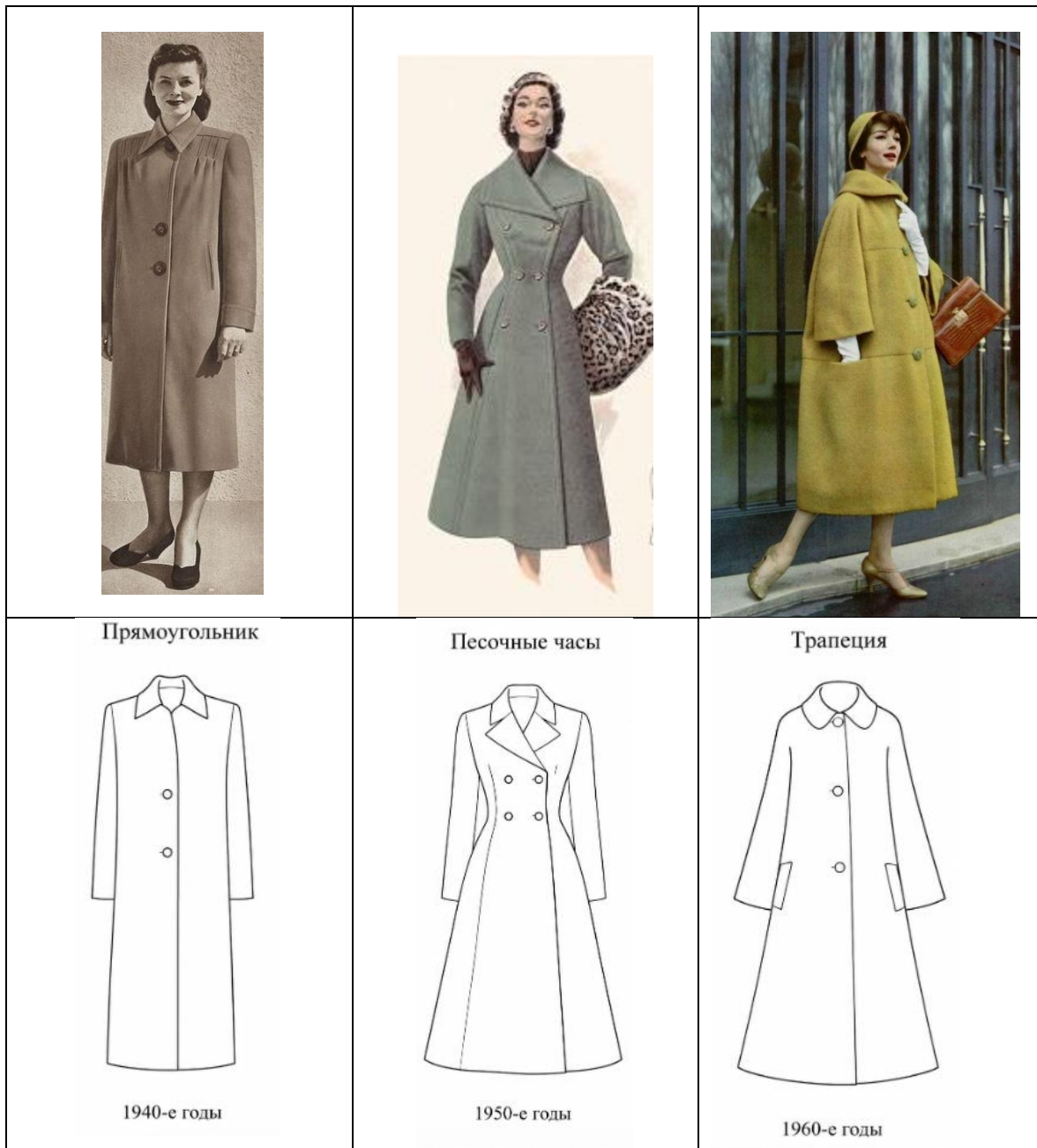
Рисунок 1. Эволюция силуэтов и пропорций женских пальто 1940–1960-х годов

Требования военного времени в Великобритании и США - в первую очередь, британская программа производства рабочей одежды 1941 года и американские правила L-85 1942 года - наложили строгие ограничения на материалы, которые, парадоксально, породили новый формальный язык для женской верхней одежды. 11 Ограниченное количество карманов (не более двух), отсутствие декоративной строчки и максимальный расход ткани от трех до четырех метров на одно пальто вынуждали дизайнеров добиваться визуального интереса исключительно конструктивными средствами: точное расположение швов, стратегическая подкладка и строгая геометрия соотношения плеч, талии и бедер.