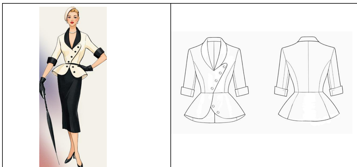
Рисунок 2. Базовые и воспроизводимые модели

В таблице 2 представлена систематическая классификация основных силуэтных кодов периода 1940–1960 годов, а шестой столбец определяет соответствующую стратегию адаптации, принятую в данной коллекции. Таблица построена вокруг шести морфологических параметров, полученных на основе анализа выкроек высокой моды и фотоматериалов того периода.