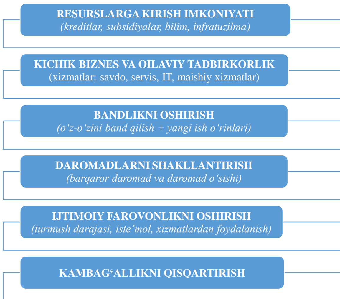
1-rasm. Xizmatlar sektorida kichik biznes va oilaviy tadbirkorlik orqali kambag'allikni qisqartirish mexanizmi (ilmiy model) 1

To'rtinchi bosqich - daromadlarni shakllantirish va barqarorlashtirish. Ushbu bosqichda bandlik natijasida aholi daromadlari shakllanadi va bosqichma-bosqich barqarorlashadi. Kichik biznesni diversifikatsiya qilish, yangi xizmat turlarini joriy etish, bozor talablariga moslashish hamda raqamli texnologiyalarni qo'llash orqali daromadlarning barqarorligi ta'minlanadi. Natijada iqtisodiy xavflar kamayadi va aholi daromadlarining uzluksizligi ta'minlanadi.