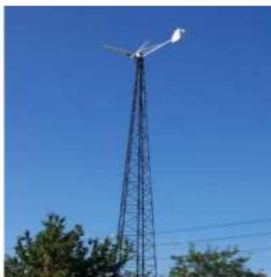
WE3000 ShES ning umumiy ko‘rinishi WE3000 ShES ning energetik tavsifnomasi